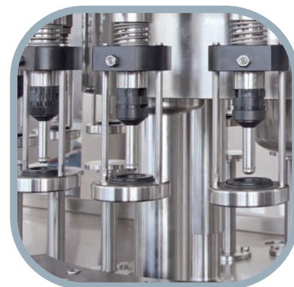
High Vacuum Высокий вакуум